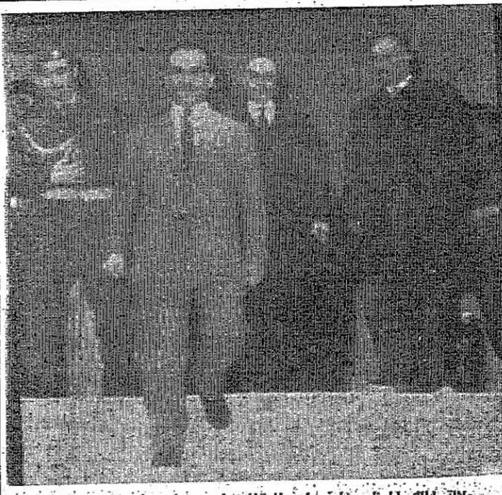
جلالة الملك المعظم يقابل زار ثلثة الوزراء بعد ان تراس اجتماع المجلس

عمان - صرح مصدر مسؤول كبير بان الدكتور غونار يارينغ المبعوث النرويجي الى الشرق الأوسط سيميل الى عمان في الأسبوع القادم لاستئناف البحث مع المسؤولين الأردنيين حول تنفيذ قرار مجلس الأمن الدولي المتعلق باحتلال السلام في المنطقة . وسيستقروا الدكتور يارينغ الى القاهرة بعد انتهاء مباحثاته في عمان .